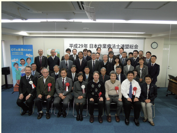
日本作業療法士連盟 集合写真

2017年度日本作業療法士連盟の総会・研修会・懇親会は、2017年2月11日に連盟事務局の移転先であるOT協会事務局が入居しているビルの10階研修室にて開催されました。