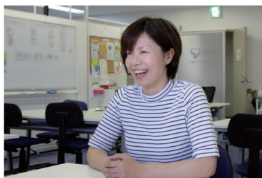
Employment support 社会参加・就労支援