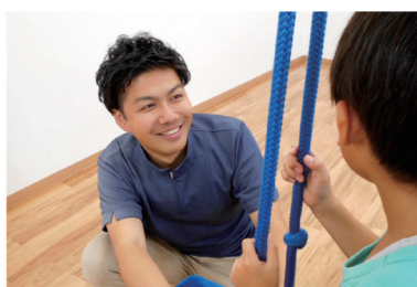
Child support 児童発達支援