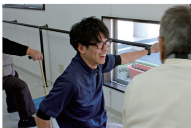
Nursing care 自立支援・介護予防